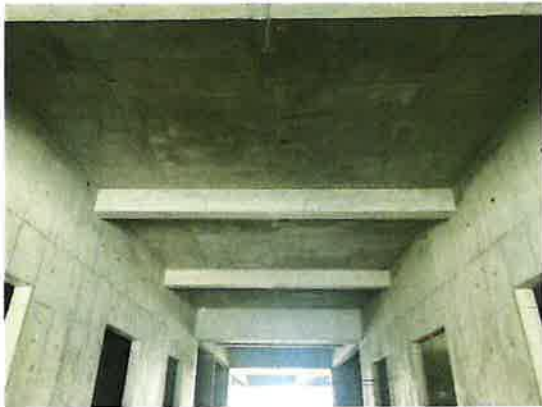
电梯井结构优化一次成型