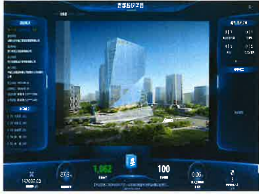
智慧安全管理系统