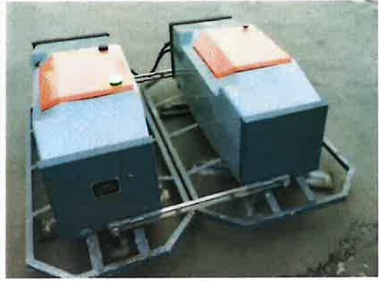
混凝土找平机器人