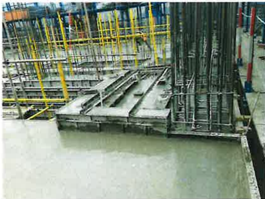
管井反坎一次成型

2. 质量管理：主体结构管井反坎及电梯井优化一次成型、精装修展示、智能实测实量工具展示；