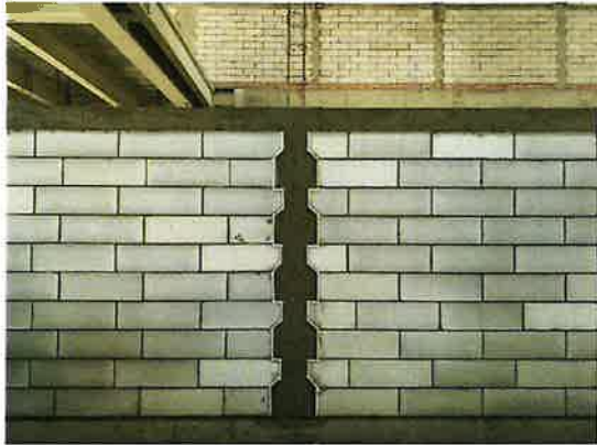
二次结构构造柱及腰梁浇筑饱满