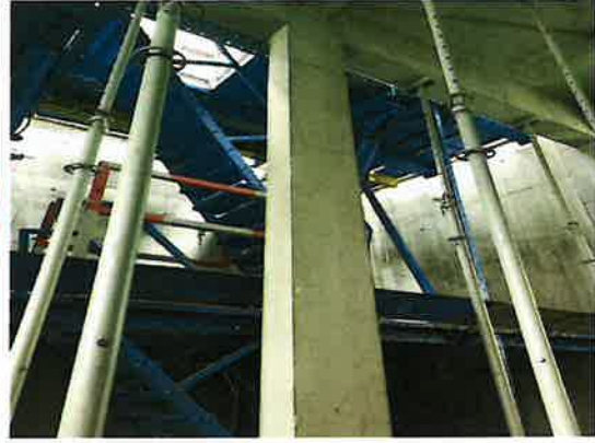
构造柱一次浇筑成型