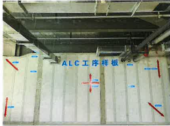
ALC隔墙板接缝美缝处理横平竖直