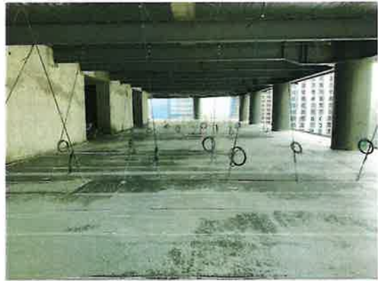
混凝土收面平整、薄膜覆盖保湿养护