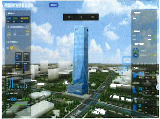
建筑能耗监测系统

2. 质量管理：主体结构管井反坎及电梯井优化一次成型、精装修展示、智能实测实量工具展示；