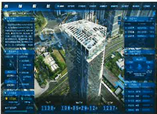
项目能源管理平台