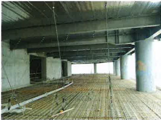
楼承板悬挂拉结工艺