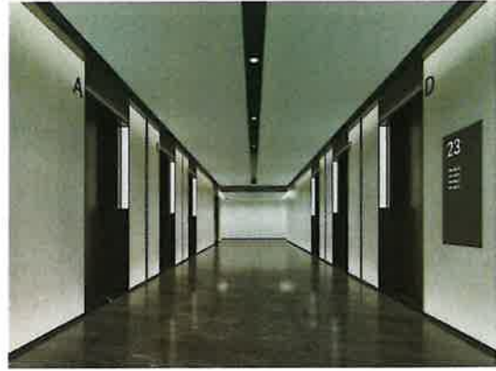
标准层电梯厅样板实景图与效果图