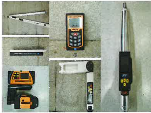
实测实量工具蓝牙传输至智慧工地平台

3. 安全管理：智能安全帽、智能体检机、智能化应急管理、网格化安全管理、有限空间安全管理、工具式安全防护等；