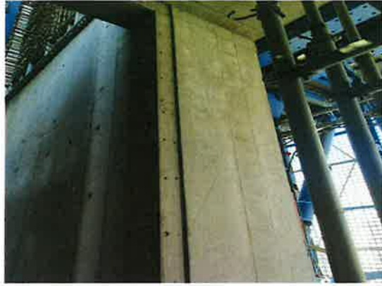
窗铝膜压槽免抹灰工艺