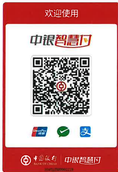
注册建造师个人会员缴费二维码